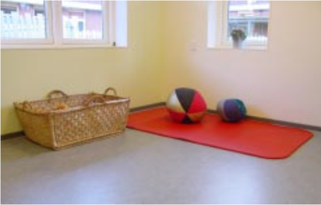
Aktivitet nr. 2: Måtte med lydbolde. Trille bold til voksen/trille bold mod væg.