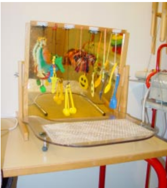
Aktivitet nr. 4: magnettavle. Grib, tag fat og undersøg genstanden. Lære at sætte magneten fast igen. Orienter sig i forhold til genstandens placering.