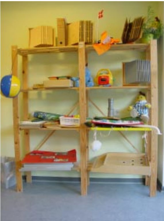
Aktivitet nr. 3: Legehylde med klodser, sætte sammen, putte i.